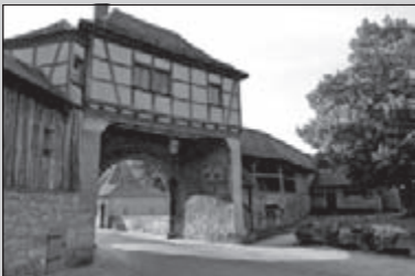
Verder op de E8