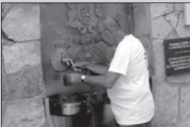
Belevissen op de Camino