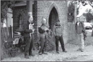
Laatste clubreis van 2009

CLUBBLAD VAN WSV OLAT • JAARGANG 35 • NUMMER 12 • DECEMBER 2009